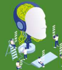
Análise de datos a través do "Deep Learning"