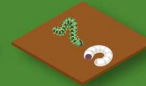
Obtención de bagazo e vermicompost e incorporación ao solo