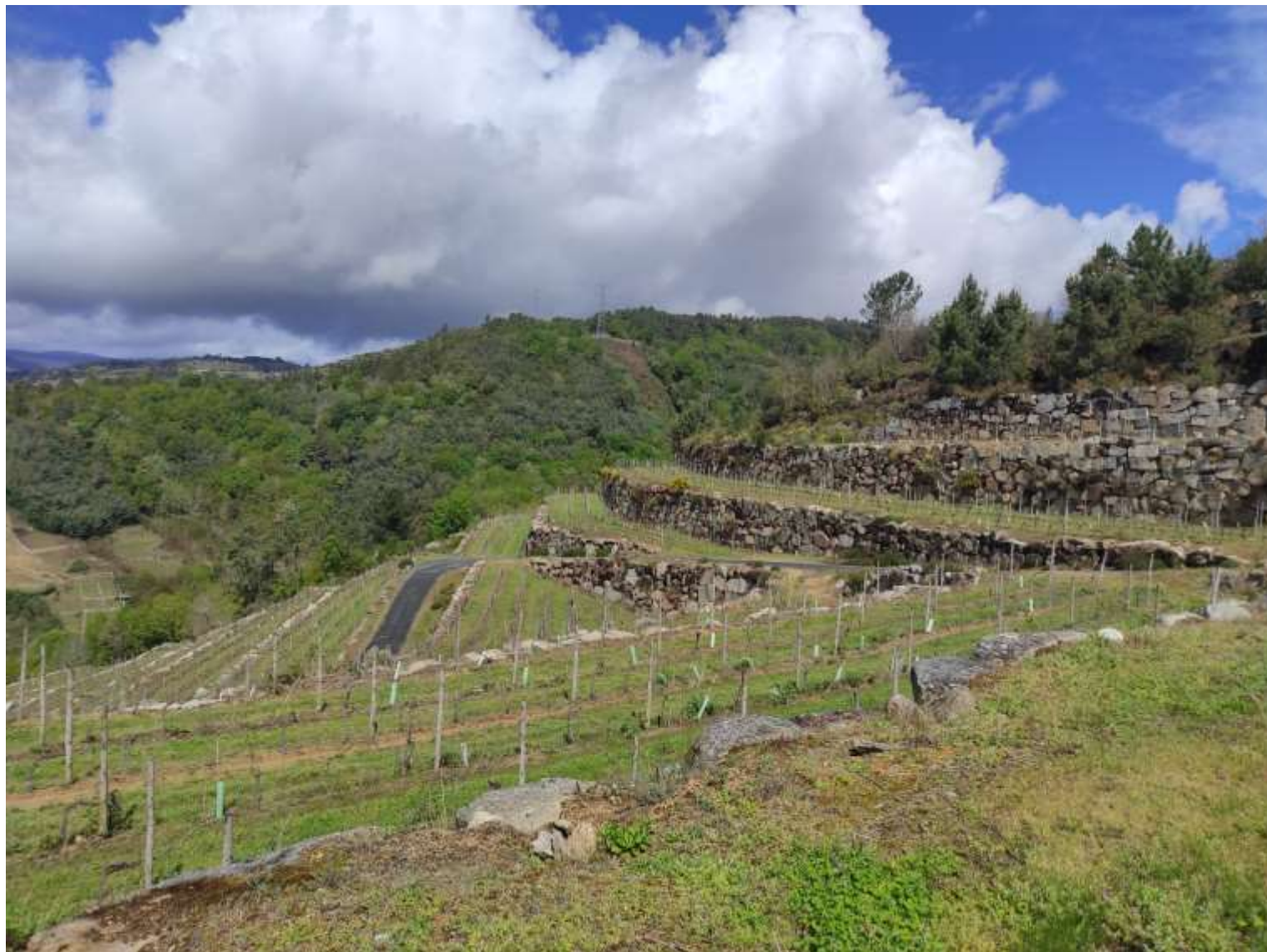
Finca Pazo de Toubes D.O. Ribeiro