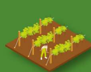
Incorporación dos restos de poda ao solo