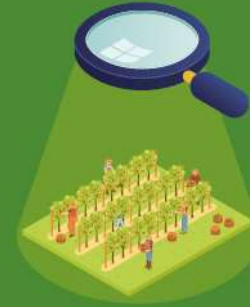
Selección das parcelas