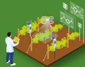
Análise ambiental e técnico-económico de prácticas de xestión